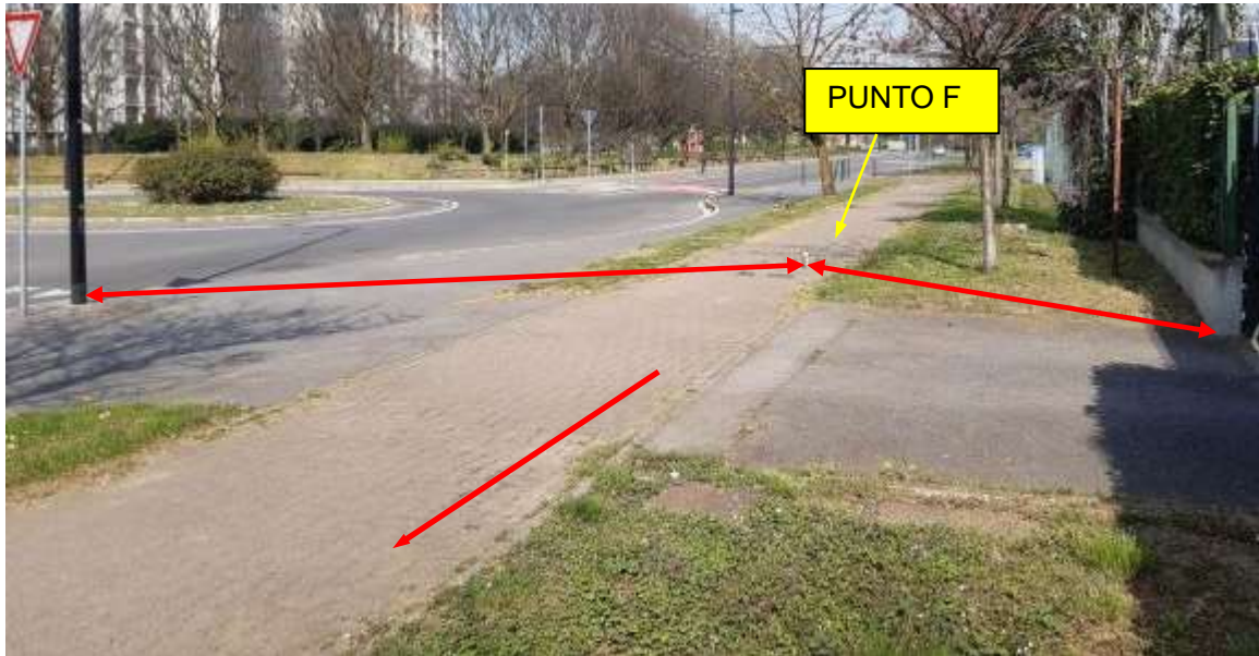
Punto F: posto a 8,78 m. dal lampione n.52368 e a 5,30 m. dal cancello del civico 64.