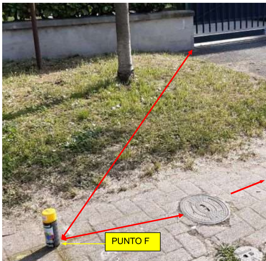
Punto F: posto a 5,30 m. dal cancello del civico 64 e a 0,70 m. dal tombino dell'idrante.